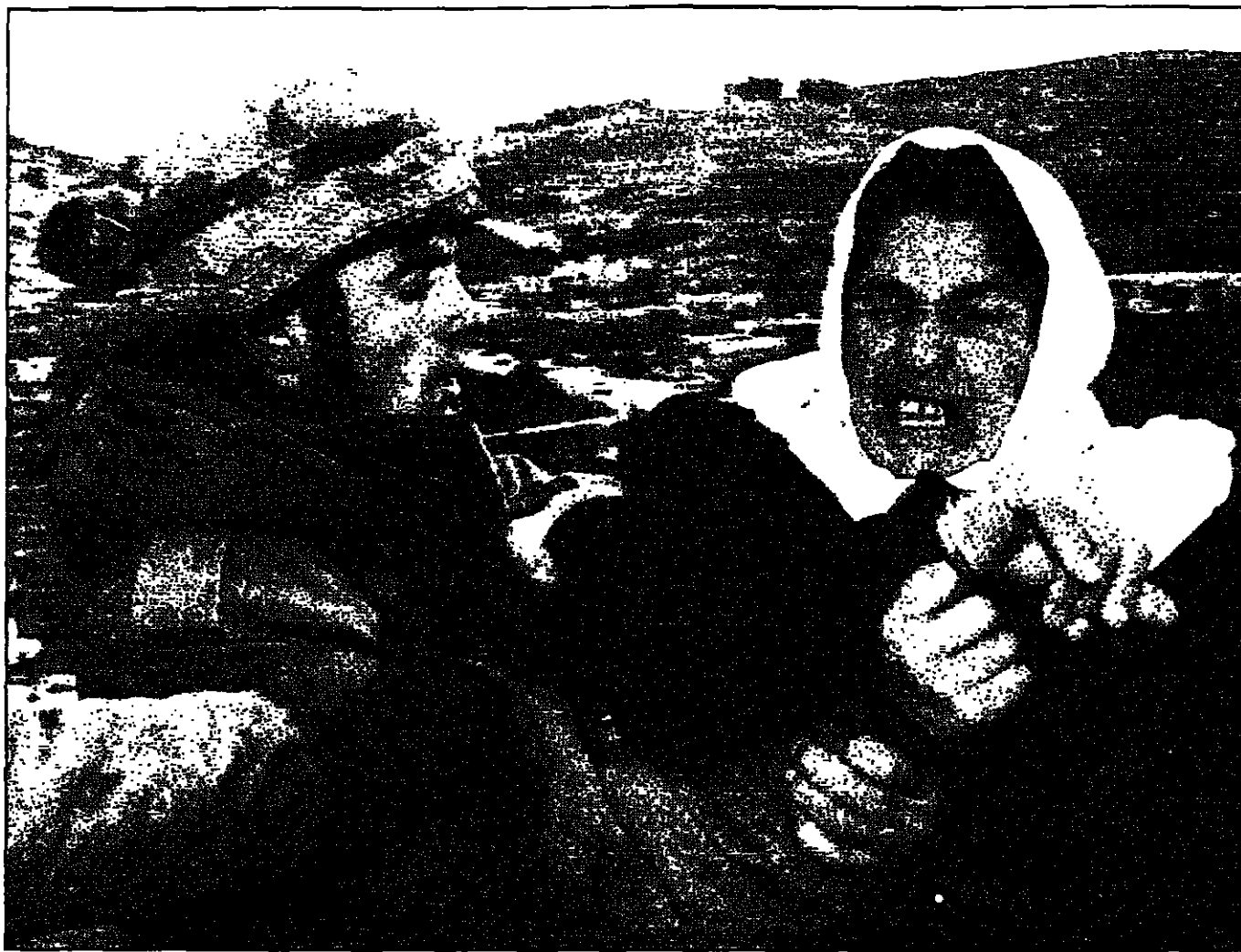
جندي إسرائيلي يتحرك بالآلية مع امرأة فلسطينية حاولت تخليص شاب اعتقلته الجيوش أثناء مظاهرات أمس في قرية بيت أبو غنيم